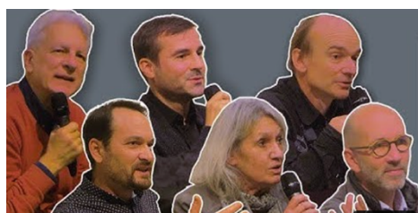
Table ronde Orsay : Penser au-delà des bouleversements actuels